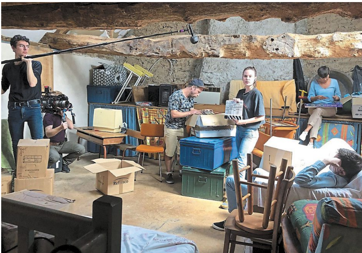
Lors du tournage dans une longère de Talensac, dimanche après-midi.

Aussi, accompagné de ses potes, il va se lancer dans un road trip qui lui permettra peut-être de régler ses problèmes avant qu'il ne les oublie. « Mais cette histoire rejaillit sur les autres, va les faire évoluer, c'est